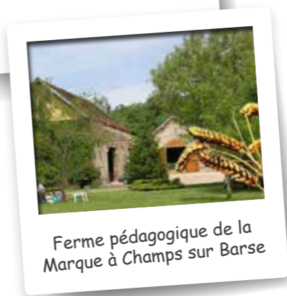
Ferme pédagogique de la Marque à Champs sur Barse