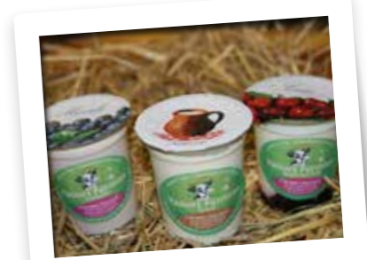
Produits de la ferme